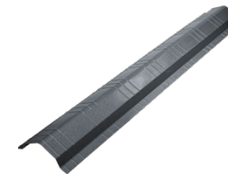
Gąsior do kalenicy skośnej GSM-FLAT [B]