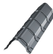
Gąsior do kalenicy prostej GSC-TOP [A]